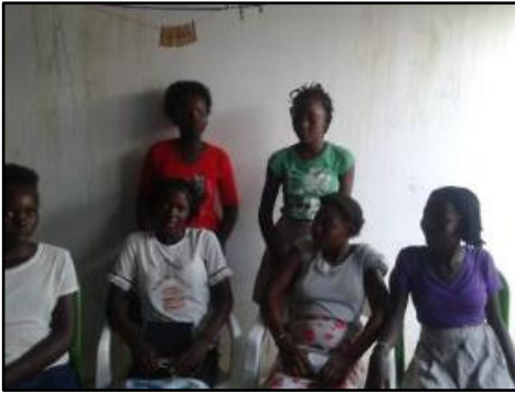
Primeiro Encontro com as Vocacionadas para acompanhamento intensivo em 2020